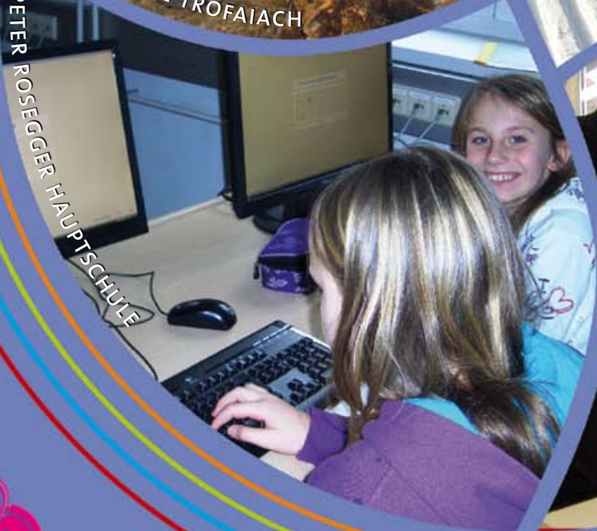
PETER ROSEGGER HAUPTSCHULE