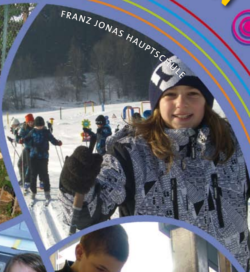
FRANZ JONAS HAUPTSCHULE