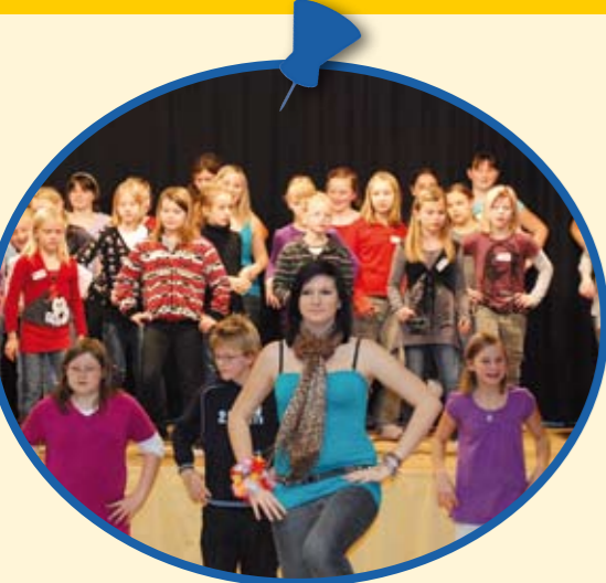
PETER ROSEGGER HS